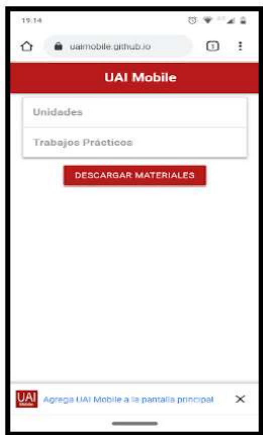
Figura 1. Ejemplo Instalación de una PWA